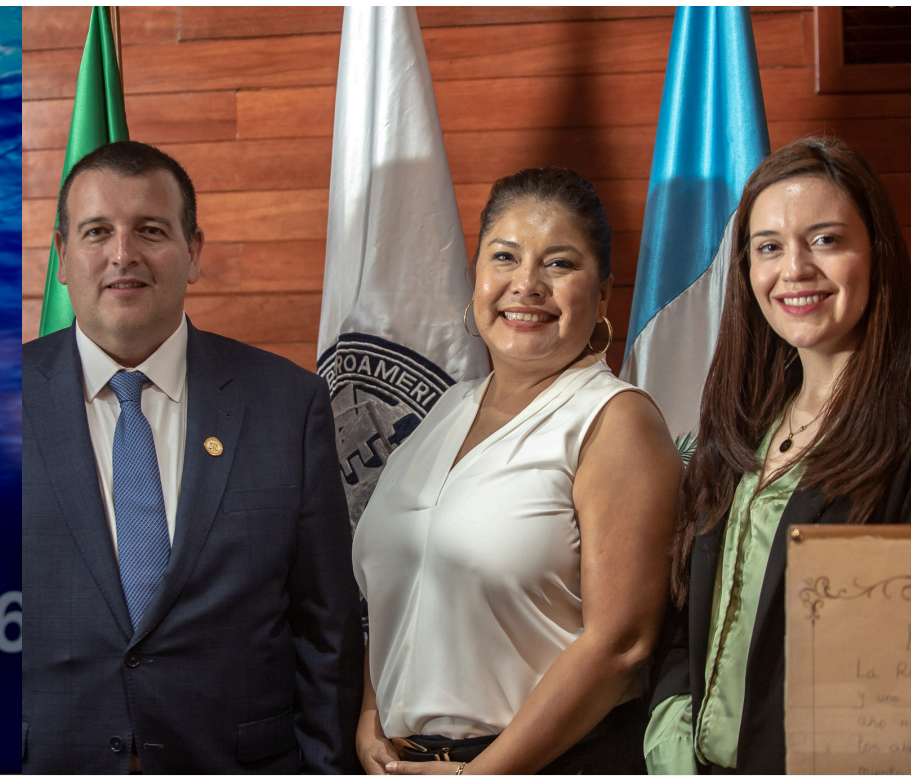
Embajadores Maritimos Organización Marítima Internacional