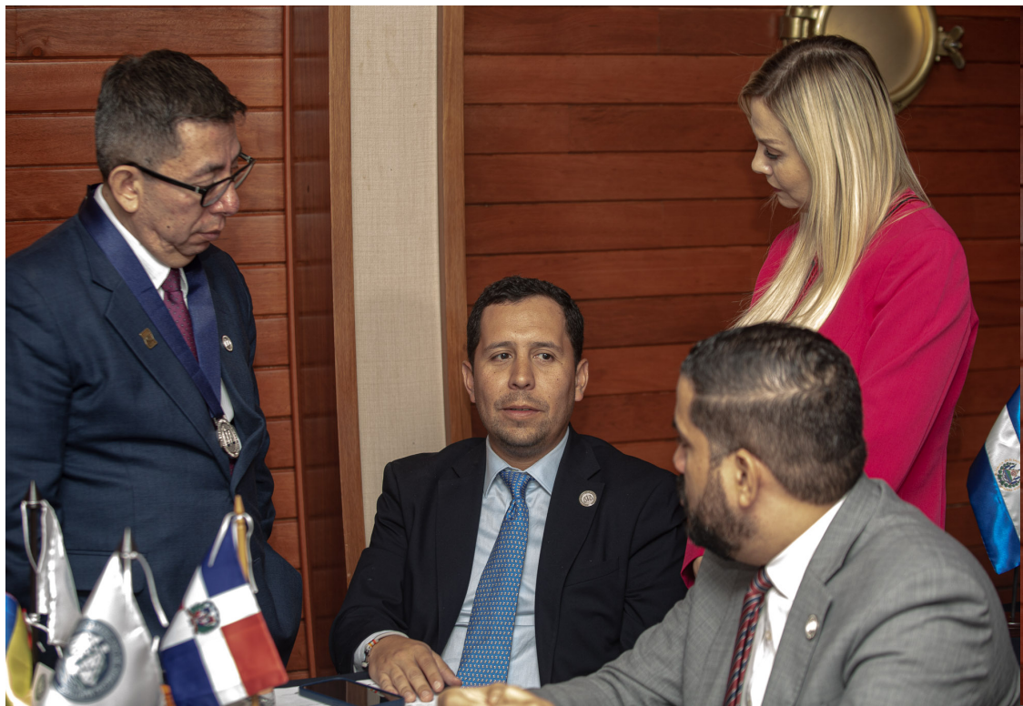
Vicepresidente Guatemala, Dominicana y Venezuela