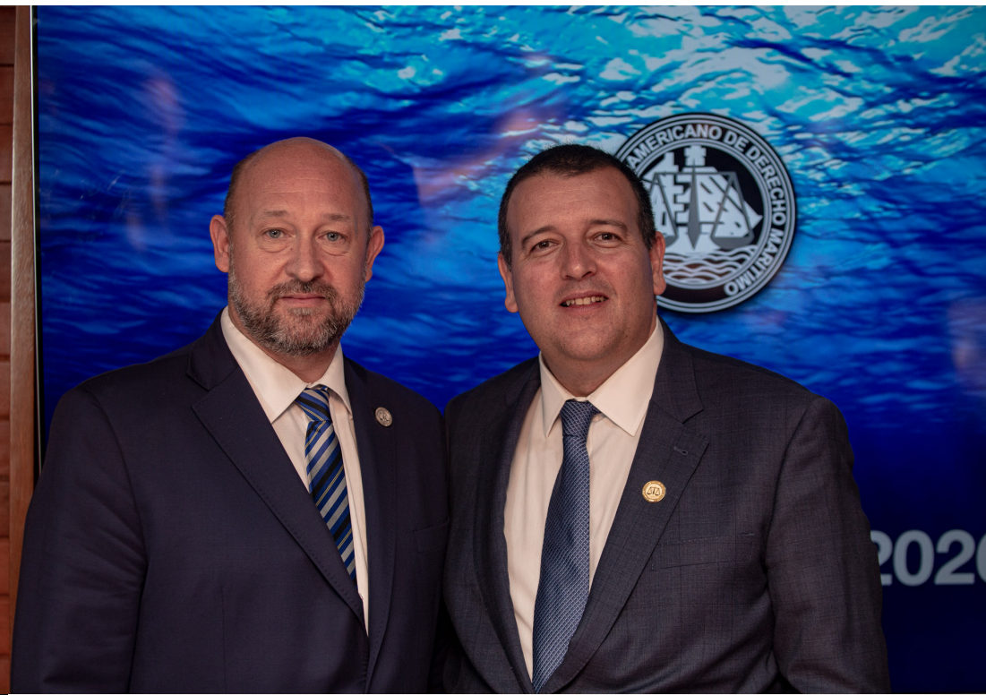
Vicepresidente Argentina y Presidente IIDM