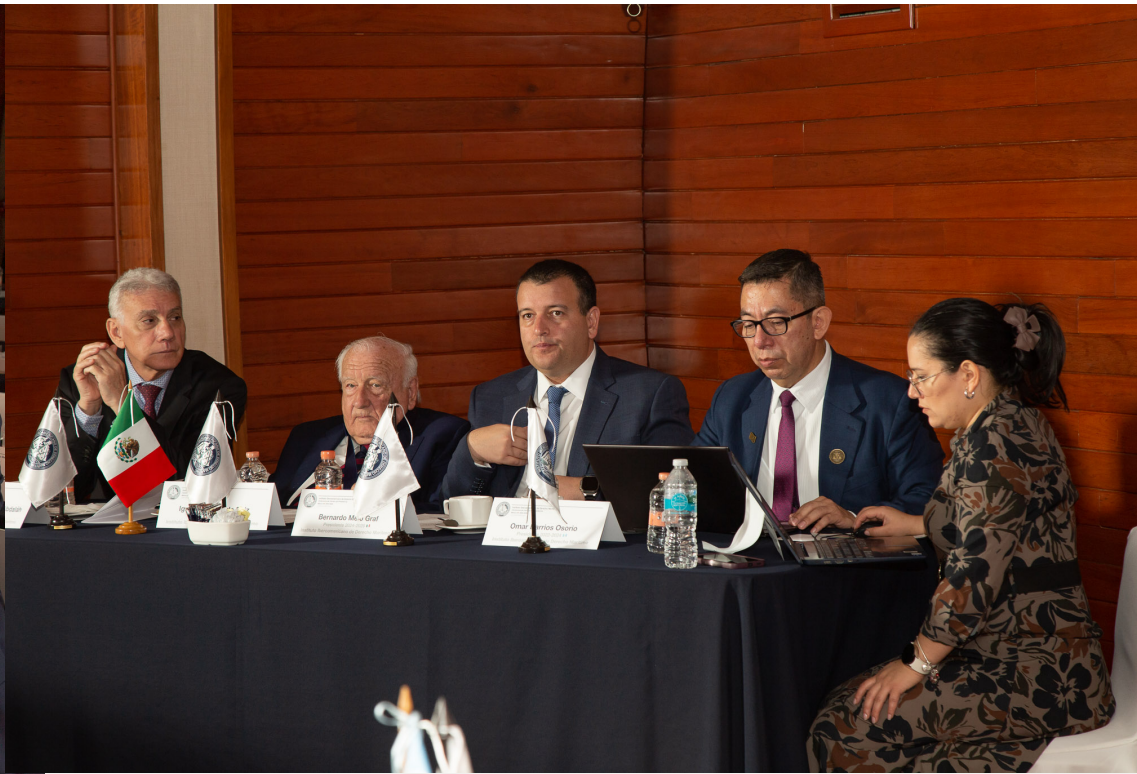
Presidentes saliente y entrante con distinguidos miembros del IIDM